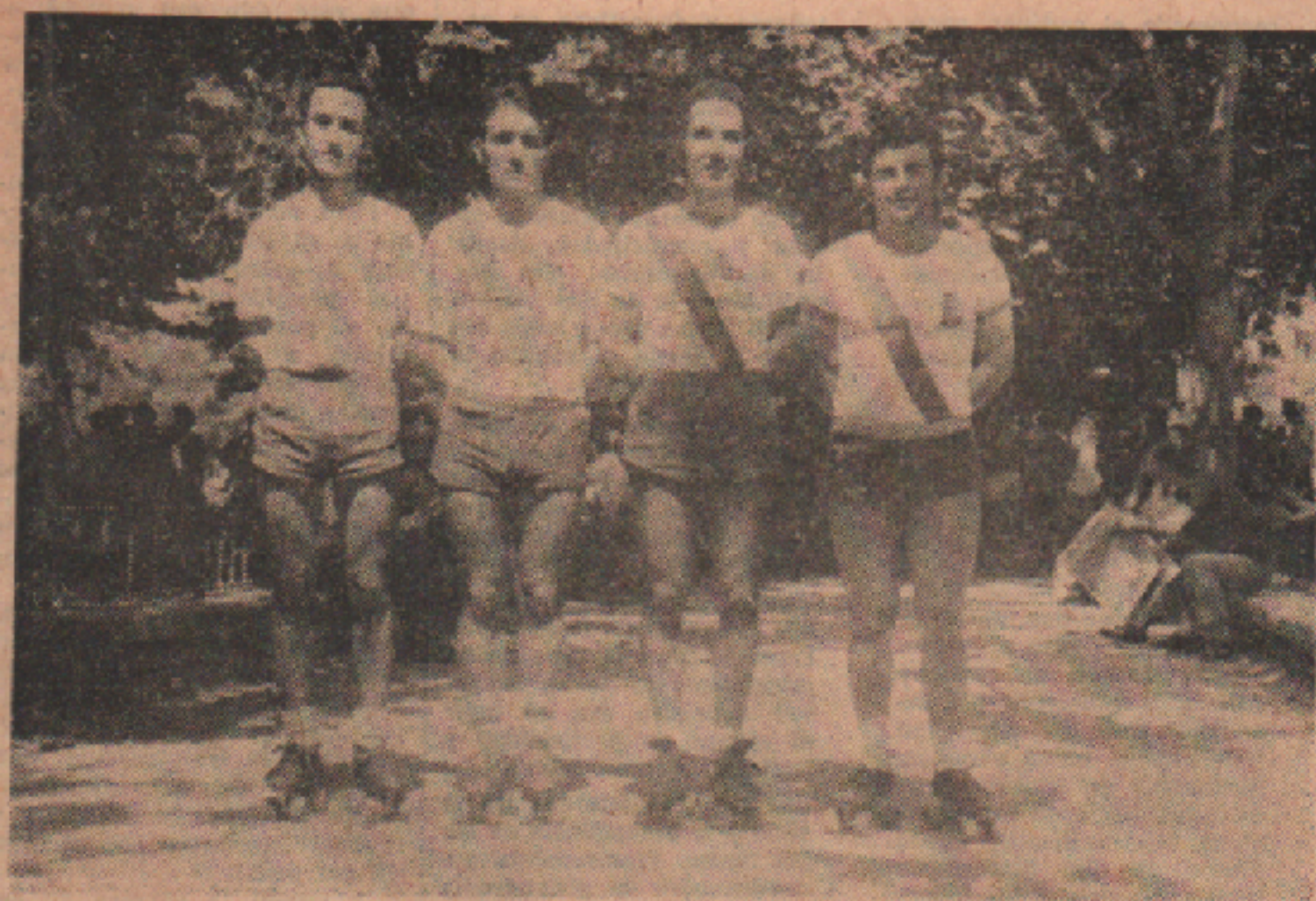
Equipo del San Antonio, dominador del Campeonato de España por Equipos.

Por no haberse celebrado el Campeonato Navarro corrieron sin puntuar y llegaron los primeros